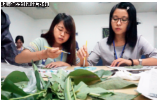
老师们在制作叶片拓印